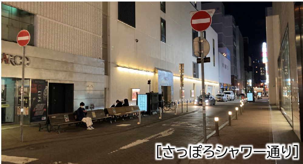
[さっぽろシャワー通り]