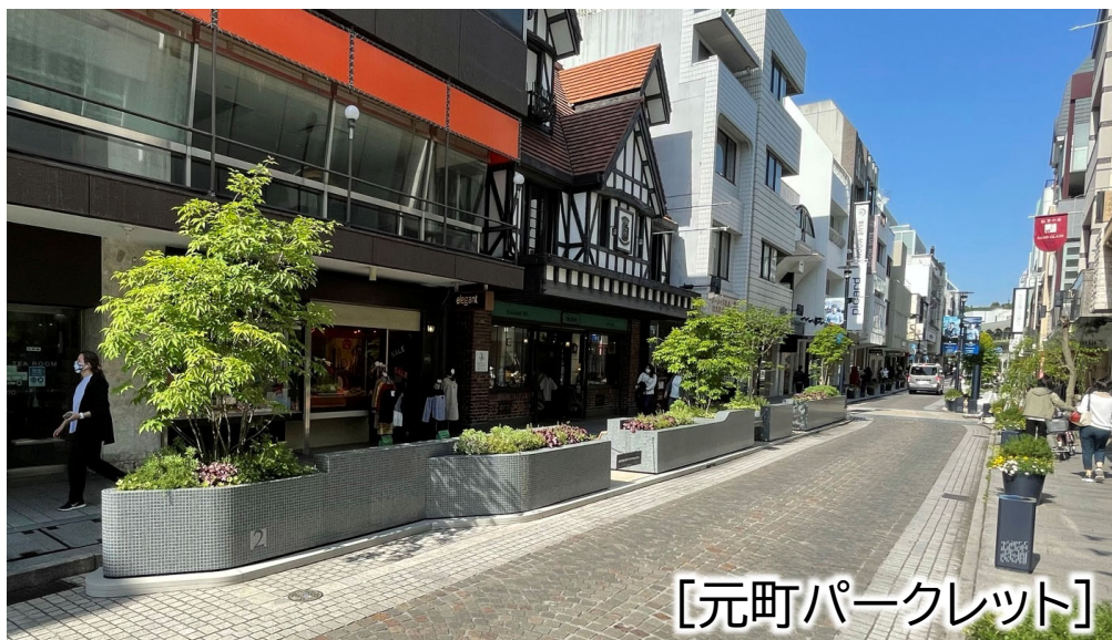
[元町パークレット]